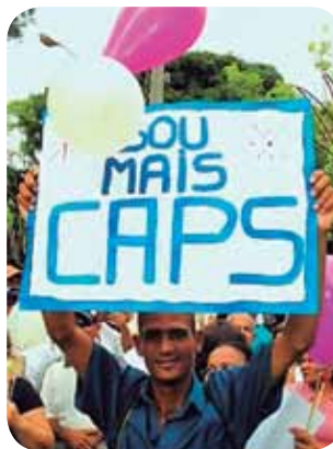
Figura 3.2: Sou mais CAPS

Desde então, o modelo de serviços dos Centros de Atenção Psicossocial - CAPS passou a ser implantado em todas as regiões do país como principal estratégia da nova Política Nacional de Saúde Mental. Nas últimas duas décadas o número de CAPS implantados expandiu de forma expressiva em todo o território nacional. Podemos, com isso, afirmar que foi o primeiro serviço aberto criado no Brasil.