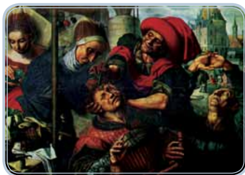
Figura 1.2: Medicina idade média – extração da loucura. Obra O cirurgião: a pedra-cutter , obras de Jan van Hemessen Sanders, 1555.

Durante a Idade Média, por influência do cristianismo, acreditava-se que todas as coisas do mundo eram ordenadas e comandadas pelos desígnios divinos. Por isso, tudo e todos obedeciam à ordem divina. Os loucos , os retardados, os miseráveis ou todo aquele que de alguma forma destoava da ordem natural, determinada pelo poder divino eram considerados pecadores. Contudo, ainda assim faziam parte da sociedade e muitas vezes acabavam sendo assistidos pelos mais abastados, como forma de penitência a qual levaria à remissão dos pecados.