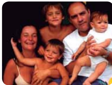
Figura 7.1: Família

O primeiro contato que temos com o mundo é através dos nossos pais. É na família que recebemos os primeiros valores, estabelecemos as primeiras relações afetivas, compartilhamos experiências e encontramos conforto.