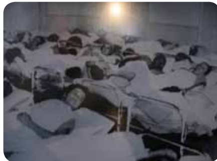
Figura 2.3: Hospital de Pedro II

O princípio básico que servia de respaldo a criação dos asilos de alienados era o afastamento do louco do meio urbano e social, quer fosse pelo distanciamento ou pela reclusão, o mais importante era que essas pessoas tivessem um espaço próprio, distante e permanente.