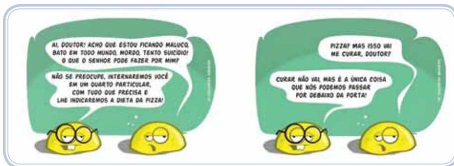
Figura 2.4: Fandangos suicida

era realizado pelas irmãs de caridade. Não havia critérios claros para classificar e separar os internados, assim era frequente a presença de órfãos adultos nas enfermarias e, comumente, registrava-se maus tratos aplicados aos alienados.