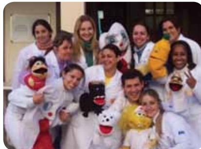
Figura 8.1: Equipe Multiprofissional CAPS Araçatuba