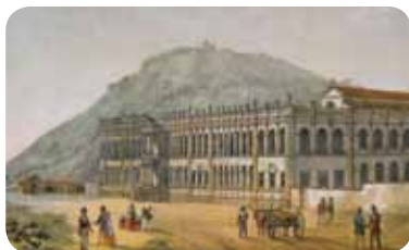
Figura 2.2: Hospício de Pedro II, 1856, obra de Eduardo Rensburg.

Essa espécie de “mapeamento dos loucos” trouxe à tona o descaso para com essa população abandonada nas ruas, nas prisões ou abandonada em hospitais gerais. Assim ocorreu a intensificação da necessidade de se pensar um lugar adequado, direcionado ao atendimento e ao abrigamento dos doentes mentais. Nesse contexto surgiram os primeiros asilos de alienados.