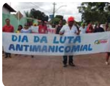
Figura 3.1: Luta antimanicomial

Em 1987, no Município de Bauru – SP houve a realização do 2º Congresso Nacional dos Trabalhadores em Saúde Mental, com o lema “ Por uma sociedade sem manicômio ”, deixando a mensagem de que não bastava humanizar os Hospitais Psiquiátricos, era necessário travar uma verdadeira batalha contra o modelo hospitalocêntrico .