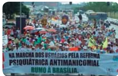
Figura 4.1: Marcha dos Usuários

A partir do ano de 1992, os movimentos sociais, inspirados pelo Projeto de Lei Paulo Delgado, conseguem aprovar em vários estados brasileiros as primeiras leis que determinam a substituição progressiva dos leitos psiquiátricos por uma rede integrada de atenção à saúde mental.