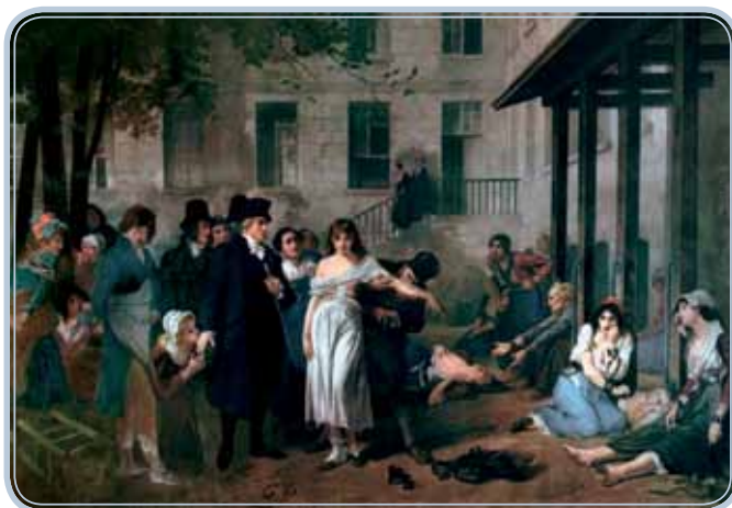
Figura 1.4: Obra Dr. Philippe Pinel à la Salpêtrière, de Joseph-Nicolas Robert-Fleury.

Essa mudança de perspectiva em relação aos doentes mentais foi sendo construída progressivamente ao passar do tempo, com a contribuição da Reforma religiosa e a formulação dos princípios de “Liberdade Individual”, os quais marcaram a passagem da Idade Moderna para a Idade Contemporânea.