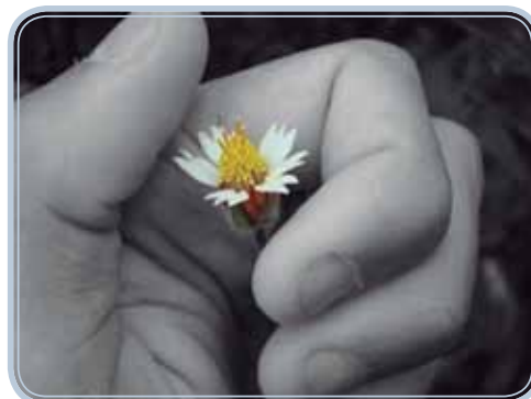
Figura 7.2: Acolher