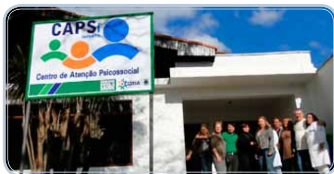
Figura 5.3: CAPS

Deve ser indicado para a fase de reabilitação visando a reinserção social do cidadão que mantém condições de convívio familiar e/ou na comunidade. Auxilia na recomposição da estrutura interna e social da pessoa como instância dentro de contínuo tratamento.