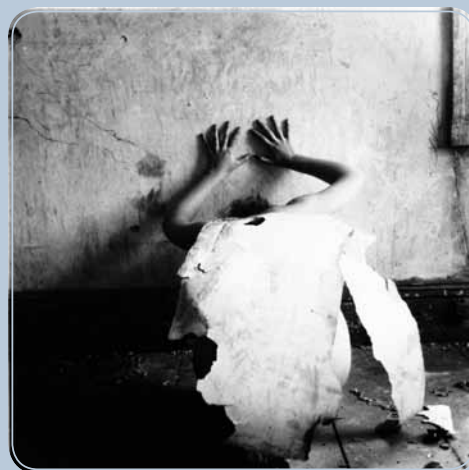
Figura 1.1: Francesca Woodman

Fonte: Disponível em < www.pensador.com.br >.