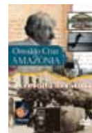
Figura 2.5: Revolta da vacina

No início do século 20, Oswaldo Cruz partiu para a Amazônia, em viagem de inspeção sanitária aos portos do Brasil, resultando em um documentário contendo depoimentos de médicos, pesquisadores e historiadores que abordam as questões sociais, políticas e culturais que envolveram a campanha de vacinação do governo de Rodrigues Alves, em plena República Velha.