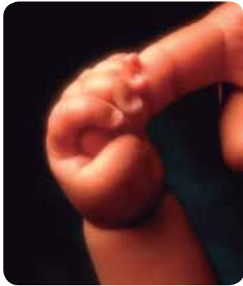
Figura 7.3: Vínculo

Sabemos que as necessidades de saúde são determinadas em grande parte pelo modo de vida de cada sujeito, a condição de vida, o direito à singularidade, o direito às tecnologias de melhoria da vida, o acolhimento e o vínculo na construção da autonomia são pontos fundamentais que vão além do espaço onde o cuidado acontece, seja a unidade de saúde ou a própria casa.