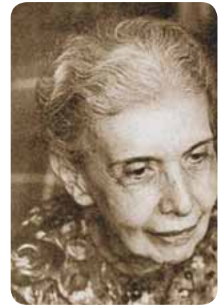
Figura 2.6: Nise da Silveira

A partir de 1981 a crítica ao modelo manicomial, de reclusão e asilamento puramente higienista desencadeia um período de importantes transformações que ocorreram até o final da década de 80, tais como a redução de leitos, reequipamento dos serviços.