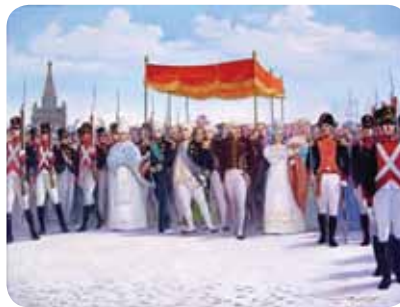
Figura 2.1: Família real

Pensando na necessidade de organizar o país desde as questões sociais até aquelas relativas à saúde, a Sociedade Médica do Rio de Janeiro (SMRJ), criou um código de posturas a partir da realização de um grande diagnóstico sanitário de todas as instituições existentes na corte e que contavam com a atuação de profissionais da saúde pública.