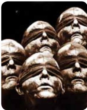
Figura 1.3: Loucura