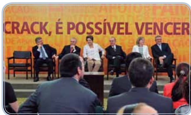
Figura 14.1: Crack é possível vencer. Tema do plano de ação do Governo Federal para o plano de enfrentamento às drogas, 2011.

Lançado pelo Governo Federal em dezembro de 2011, o novo plano de ação de enfrentamento às drogas tem como tema “Crack é possível vencer”. Trata-se de um conjunto de medidas, que pretende reorganizar o atendimento aos dependentes químicos na rede do Sistema Único de Saúde (SUS), tem como parceria os Ministérios da Saúde, Educação e Justiça, além de entidades do terceiro setor como a Central Única das Favelas (Cufa) e Comunidades Terapêuticas.