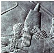
Guerreiros da Babilônia

assiriólogos, deixou estupefatos todos os historiadores que dela tomaram conhecimento. A versão bíblica do Gênesis teve de sofrer uma re-leitura, em virtude dos novos fatos que vieram a público.