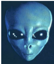
Face típica de alienígena

supercílios proeminentes (arcada superciliar), tem se adiantado e se tornado mais lisa. A longo prazo, a tendência dos pelos e dos cabelos é a de desaparecer. O queixo deverá se reduzir, inclusive pelo desaparecimento progressivo dos dentes, a começar pelos últimos molares. O seio facial deverá se modificar, com as aberturas dos sinus deslocando-se para baixo. Com isto, o crânio deverá se tornar redondo, com base curta, dando-lhe um formato triangular.