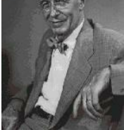
Foto do Dr. Vannevar Bush