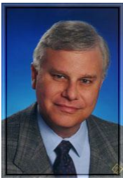
O escritor e contatado Whitley Strieber

Em Comunhão , outro livro seu, ele diz ainda que "eu não ficaria absolutamente surpreso se os visitantes fossem reais e estivessem, lentamente, entrando em contato conosco, seguindo uma programação por eles criada, que prossegue à medida que a compreensão humana aumenta. Se eles não pertencem ao nosso universo, será necessário entendê-los antes que possam surgir em nossa realidade. Em nosso universo, suas realidades podem depender de nossa crença. Então o corredor para entrar no nosso mundo seriam, na verdade, as nossas próprias mentes". Strieber diz ainda que pode ser "um fato muito real que entidades físicas saiam do inconsciente".