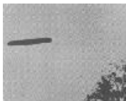
Uma nave em forma de charuto

Observações ocasionais, mas que jamais chegaram a influenciar a opinião pública, tiveram lugar em fins do séc. XIX e início do séc. XX. Objetos em forma de balão (tipo charuto), deslocando-se lentamente, foram avistados nos EUA, em meados de 1897, principalmente nos estados do Texas e da Califórnia.