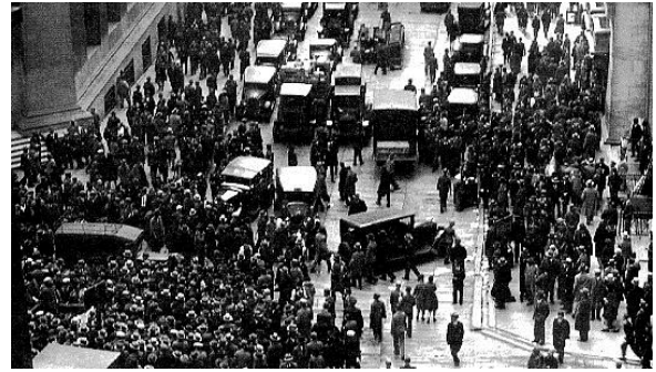
Wall Street – Símbolo personificado do Capitalismo

Diante desta situação, os grandes empresários passaram a especular na Bolsa de Valores, atribuindo as suas ações preços irrealistas, muito mais altos. Os investidores passaram a desconfiar e a partir de setembro de 1929, colocaram simultaneamente seus títulos a venda e a bolsa entrou em declínio, mas era o primeiro passo para o colapso.