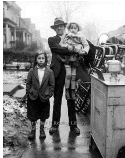
A pobreza e o desemprego pós 1929

Não só os EUA sofreram com a quebra da bolsa, mas também a Europa que viu os créditos estrangeiros evaporarem, e a América Latina cujos países não tinham como repassar na mesma proporção suas matérias primas.