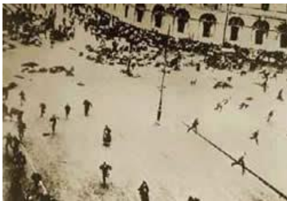
Domingo Sangrento em São Petersburgo

O regime Czarista russo era baseado principalmente na expansão militar. Em 1904 o Czar russo Nicolau II mobilizou tropas em direção ao Pacífico, entrando em choque com o Imperialismo Japonês. A mobilização para a guerra associada a uma derrota para o Japão acentua a fragilidade do sistema czarista e os problemas sociais russos, levando a eclosão de um movimento popular pacífico em frente ao Palácio de Inverno do Czar, mas que foi violentamente reprimido por ordens de Nicolau II. O movimento ficou conhecido como Domingo Sangrento e despertou uma onda de protestos por todo o Império (greves trabaladoras, rebeliões camponesas e motins militares).