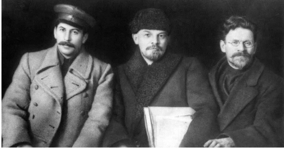
Stálin, Lênin e Kalinin

Permanente ou Mundial , sendo necessário o apoio de países avançados para manter vivos os ideais da Revolução Russa, sendo liderados por Leon Trotsky . Diferentemente, social-nacionalistas acreditavam no modelo socialista único devendo ser consolidado primeiramente na Rússia, sendo liderados por Josef Stálin .