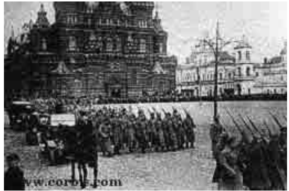
Tropas do Exército Vermelho

Logo que a guerra acaba em 1918, os países capitalistas temendo que os rumos da Revolução Russa pudessem influenciar os trabalhadores europeus, resolvem apoiar os anti-bolcheviques (oficiais do exército russo, czaristas e liberais) que formam o Exército Branco para combater o governo socialista. Em contrapartida uma guarnição militar constituída pelos bolcheviques as vésperas da revolução de outubro que originou a guarda vermelha após a tomada do poder tornou-se o Exército Vermelho dirigido por Trotsky, foi ampliado para fazer frente ao Exército Branco.