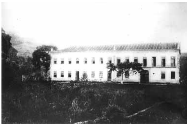
(Fazenda Produtora de Café no Vale Paraíba)

em relação ao açúcar é em relação à separação entre a produção e a comercialização, pois no produto adocicado, as decisões dependiam do setor comercial, os senhores de engenho se tornaram sócios minoritários, enquanto que no café, como foi produzido num país recentemente emancipado, deu um maior espaço de atuação dos produtores, no escoamento, no transporte, pois os mesmos tinham boa capacidade comercial.