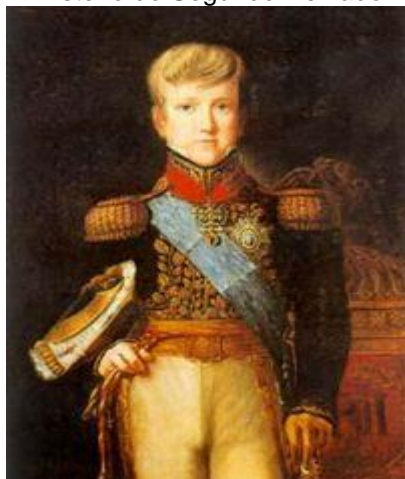
(D. Pedro II)

Com a abdicação de D. Pedro, o Brasil se viu em instabilidade, graças ao caráter transitório em que se apresentavam as regências, um substituto do poder legítimo. Para conter o perigo de fragmentação territorial a antecipação da maioridade de D. Pedro começou a ser cogitada. Levada a Câmara, a proposta foi aprovada, e em 1840, com 15 anos incompletos, D. Pedro jurou a Constituição e foi aclamado D. Pedro II. O proposta foi maquinada por liberais, que aliados do poder, maquinaram esse “Golpe”, para seu retorno, uma vez que comporam o primeiro ministério do Segundo Reinado.