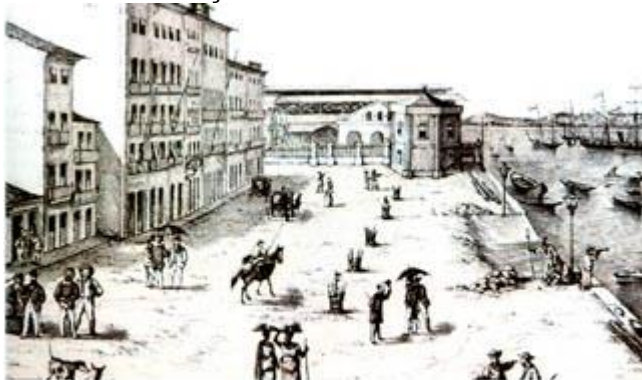
O porto em Recife, o marasmo no cais do Trapiche, indicam a decadência da economia pernambucana.

Neste período o nordeste passa por uma enorme seca, e conseqüentemente grande queda na taxa de exportação, com os senhores perdendo grande parte de seu lucro, e quase desaparecimento da cultura de