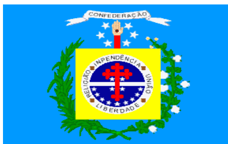
(Bandeira da Confederação)

Pretendia a adesão das demais províncias e o apelo foi encampado por Ceará, Rio Grande do Norte e Paraíba, que com Pernambuco formaram a Confederação do Equador. Adotou-se a Constituição colombiana, e assim tentou se formar um Estado desvinculado do restante do Império, baseado na representatividade, republicanismos, federalismo, para que os Estados associados tivessem autonomia.