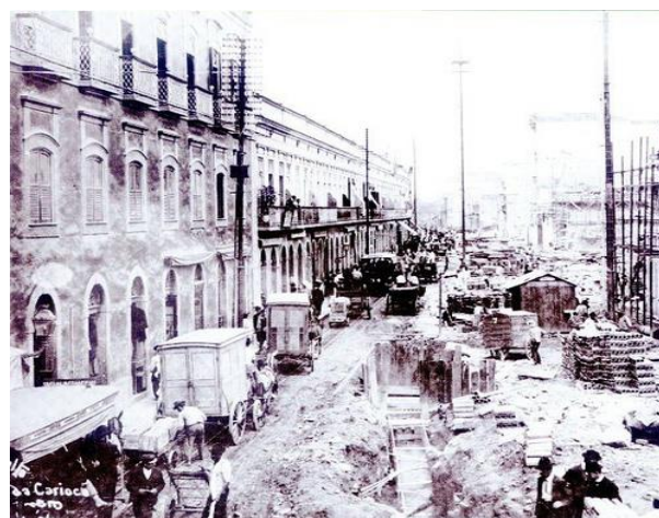
(Urbanização do Rio de Janeiro)

Temos ainda no mesmo ano o Alvará de 1º de Abril, que revogava o alvará de 1785 que proibia a instalação de manufaturas no Brasil. A partir desta data estava liberada a implementação das manufaturas e indústrias no país. No entanto, esta lei não trouxe efeitos imediatos, pois era impossível concorrer com os produtos ingleses. Além disso, a elite senhorial e seus interesses, a escravidão que impossibilitava um mercado consumidor em grande escala e a estrutura tipicamente agrária explicam a falta de sustentação para o desenvolvimento manufatureiro.