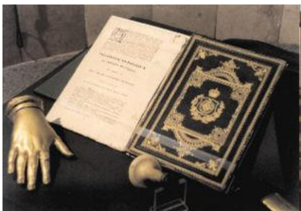
( A Carta Outorgada)

Já o Poder Moderador pertencia exclusivamente a D. Pedro, e deveria ser a princípio um Poder neutro, cuja função seria garantir a harmonia dos três outros poderes. No entanto, uma vez instituído no Brasil, este passou a ser o centro de poder, tornando-se instrumento da vontade do Imperador. A este poder, cabia aprovar ou não as decisões do legislativo, nomear senadores e dissolver a Câmara. Ao Executivo, restava o poder de escolher os membros do Conselho de Estado, além de nomear e demitir presidentes e funcionários das províncias, que estavam submetidas ao Moderador, impedindo assim tendências autonomistas.