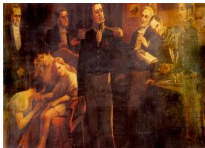
D. Pedro entregando o ato de renúncia.

No Rio, D. Pedro encontrou um conflito entre partidários seus e liberais, na famosa Noite das Garrafadas. Para conter os radicais o Imperador tentou reformar o ministério Brasileiro, criado para os Brasileiros, mais que até então, não tinha sido ocupado pelos mesmos. Foi organizado um ministério, agora claramente com propósitos absolutistas, com membros que apoiavam o império de forma clara.