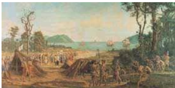
Fundação de São Vicente – Oscar Pereira da Silva (1900).

altamente lucrativo, razão pela qual foi à opção de mão de obra utilizada na colonização.