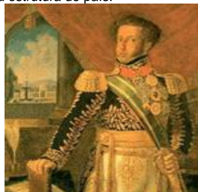
(D. Pedro I)

D. Pedro, não pretendia retornar a Europa, e se aproximou dos brasileiros, reforçando sua posição para as “Cortes”. D. Pedro era cortejado pelos Brasileiros e pelos Radicais, que envergavam nele o líder capaz de alterar a ordem. Por outro lado, José Bonifácio, tentava afastá-lo dos radicais afirmando que estes tentariam implantar uma República, onde os Bragança perderiam seu lugar. O caminho para este seria a aliança com os Brasileiros e uma negociação com as “Cortes” para evitar a recolonização. No entanto, com a posição das “Cortes” não restou outro caminho ao partido a não ser o da defesa a emancipação, para que não se prejudicasse os seus negócios. Nesse momento ocorre a junção de circunstâncias, o Partido Brasileiro enxergando um líder para romper os laços com Portugal e este líder encontrando no partido o apoio contra os lusitanos. A Independência, no entanto, iria ter algumas condições: manter a população longe do movimento, manter a unidade territorial e não alterar a estrutura do país.