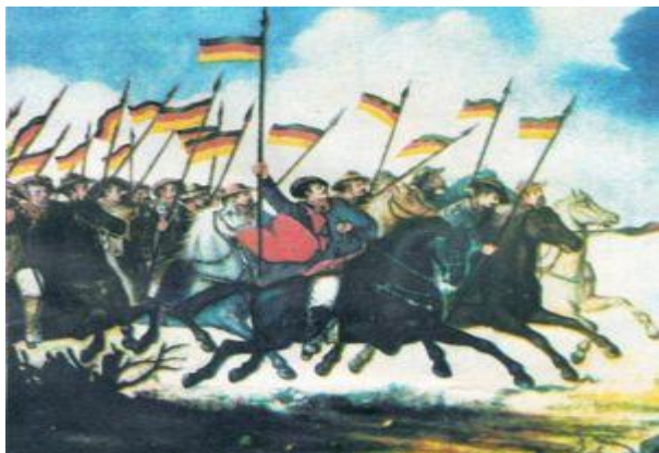
(Cavalaria dos Farrapos)

Em 1840 com a maioria de D. Pedro II, foi oferecida anistia aos revoltos, mais os farrapos continuaram na luta. Somente em 1842 com a designação de Caxias (futuro duque) os farrapos foram dominados. Caxias cortou as vias de comunicação com o Uruguai, e negociou com os revolucionários para abrandar o animo revolucionário. Em março de 1845 através de um acordo entre governo e liderança farroupilha chegava ao fim o movimento, com várias concessões: anistia geral aos revoltosos, incorporação dos soldados ao exército imperial em igual posto, e devolução de terras que haviam sido confiscadas pelo governo.