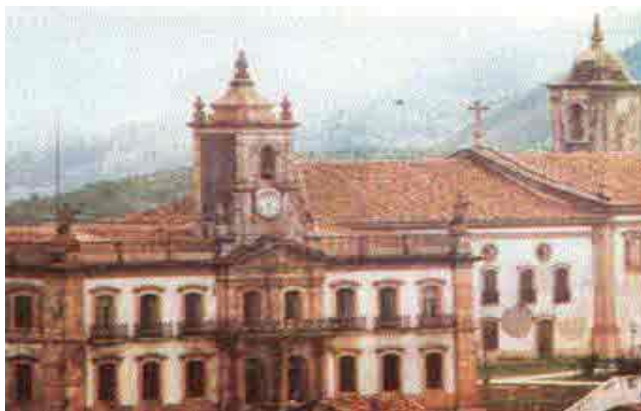
(Ouro Preto, antiga Vila Rica)