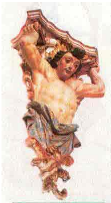
escultura de Aleijadinho em Sabará (Igreja Nossa Senhora do Carmo)

A acentuação da vida urbana trouxe também mudanças culturais e intelectuais, destacando-se a chamada escola mineira, que se transformou no principal centro do Arcadismo no Brasil. São expoentes as obras esculturais e arquitetônicas de Antônio Francisco Lisboa, o "Aleijadinho", em Minas Gerais e do Mestre Valentim, no Rio de Janeiro.