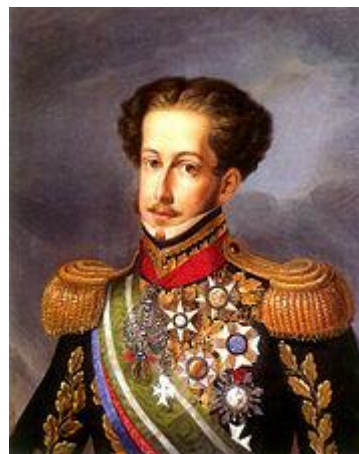
(D. Pedro I)

Com essas características, o anti-projeto foi alvo de críticas. A insistência em cercar o poder de D. Pedro fez com que o mesmo se voltasse contra a proposta. No entanto, o que vai definir a situação é um acontecimento inusitado.